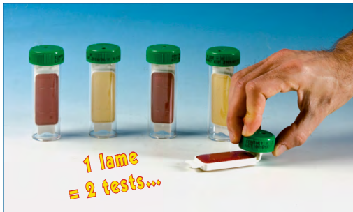
Appliquer la lame gélosée sur la surface.

Les lames gélosées vous permettent de contrôler quantitativement la désinfection des surfaces de travail, du matériel, des mains, des vêtements. Vous pouvez donc facilement comparer les résultats dans le temps. Conforme NF ISO 18593.