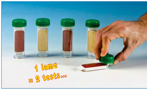
Appliquer la lame gélosée sur la surface.

Les lames gélosées vous permettent de contrôler quantitativement la désinfection des surfaces de travail, du matériel, des mains, des vêtements. Vous pouvez donc facilement comparer les résultats dans le temps. Conforme NF ISO 18593.