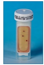
Compter les colonies.