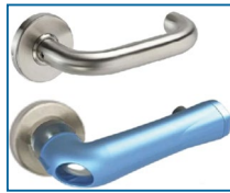
Surpoignée antimicrobienne pour poignée avec retour