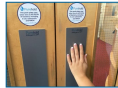
Plaque push antimicrobienne