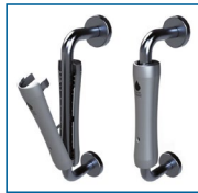
Surpoignée antimicrobienne pour poignée en U