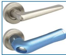
Surpoignée antimicrobienne pour poignée droite