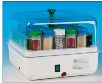
L'incuber dans une étuve pendant 18 h à 48 h à 35-37°C.