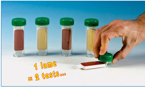
Appliquer la lame gélosée sur la surface.

Les lames gélosées vous permettent de contrôler quantitativement la désinfection des surfaces de travail, du matériel, des mains, des vêtements. Vous pouvez donc facilement comparer les résultats dans le temps. Conforme NF ISO 18593.