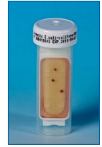
Compter les colonies.