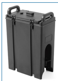
Distributeurs de boissons isothermes.

Maintiennent les boissons chaudes ou froides à T° pendant des heures.