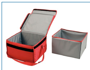
Sac isotherme à bandoulière.