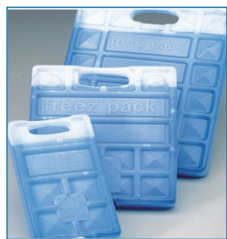
Accumulateurs de froid.

M5 : 150x76x24 mm (glacière 1 à 6 L). M10 : 180x95x32 mm (glacière 1 à 10 L). M20 : 200x170x30 mm (glacière 10 à 19 L). M30 : 273x200x30 mm (glacière 19 à 32 L).