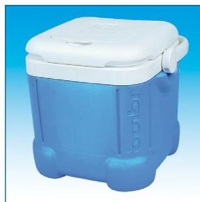
Glacière portable 11 L.