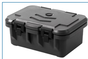
Conteneur isotherme GN1/1 (interne).