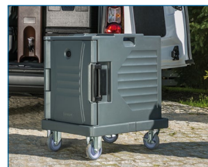
Conteneur isotherme 2 x GN1/1 H200 mm.

Double paroi : excellente isolation pour chaud ou froid. 2 poignées.