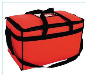
Grand sac isotherme à bandoulière.