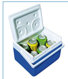
Glacière portable 4,7 L.