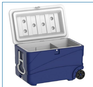
Glacières très robustes à 2 roues.