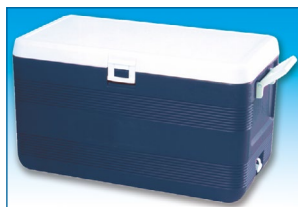
Glacières très robustes en PEHD.